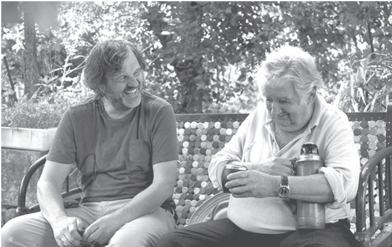
El Pepe, una vida suprema es resultado de un interés por dibujar la excepcionalidad de un individuo. Un documental único en la noche inaugural del Festival.